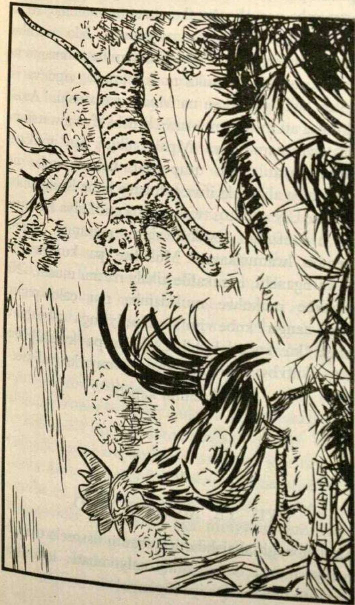
MPAKA AISAIMA NE BAKA UKUTI EKATE KAMPAMBA